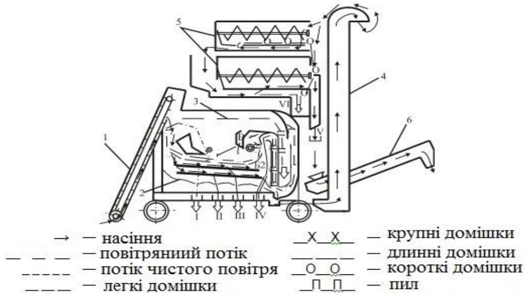
Рис. 1. Схема технологічна машини МС-4,5:

без трієрів слід переключити заслінку режиму роботи у верхній голові елеватора. Тоді зерно виводиться на транспортер 6. При очищенні оберемка, у якого довжина частинок основного матеріалу (наприклад, вівса) більше довжини решти домішок, сходом з овсюжнього циліндра піде основний матеріал, а в лоток будуть виводитися домішки.