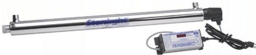
Рис. 2. УФ лампа R-CAN "Sterilight" типу S8Q-PA/2 з окремим блоком живлення (продуктивність 1,8 м 3 /год).