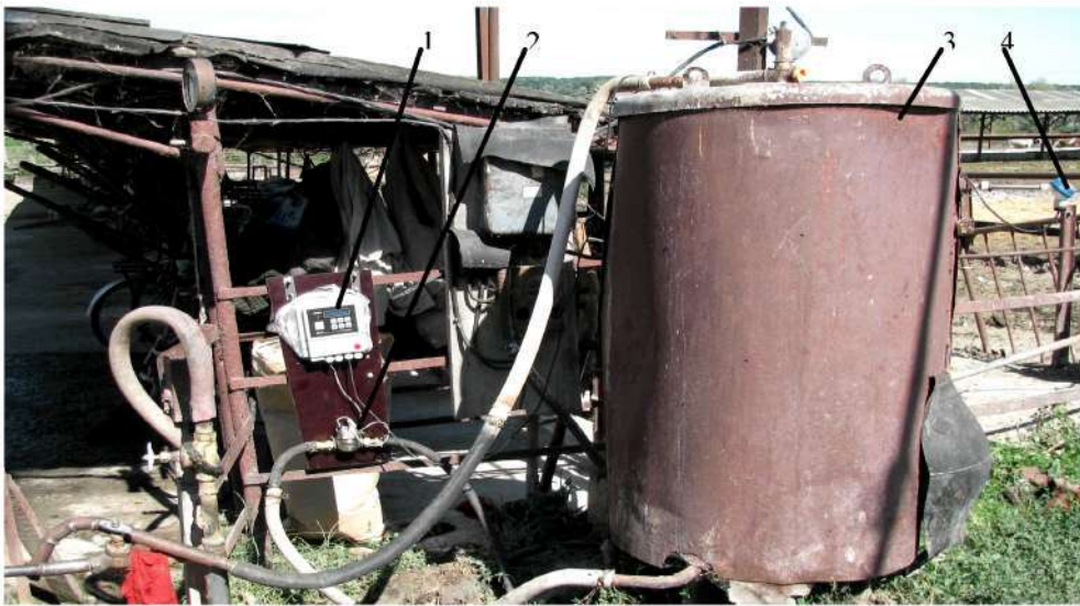
Рис. 1. Вид летнего табора с оборудованием для нагрева и учета воды

В течении мая-сентября 2008 г. был проведен почасовой учет расхода горячей воды на молочной ферме опытного хозяйства “Золото-ношское” Золотоношского района Черкасской области. В летнем лагере содержалось 297 дойных коров при их двухразовом доении. На рис. 1 показано оборудование для подогрева и учета горячей воды. Подогретая в водонагревателе 3 вода через водяной счетчик 2 используется для технологических потребностей. Температура воды в водонагревателе измеряется термопреобразователем сопротивления 4, а учет горячего водопотребления – тепловычислителем СПТ 941.