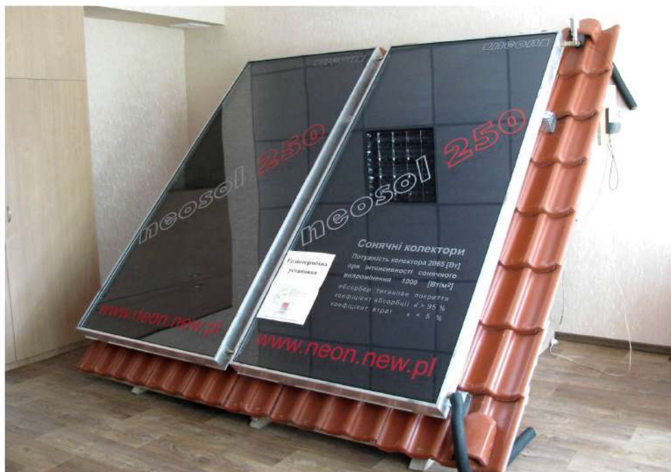
Рис. 3. Солнечные коллекторы neosol 250 в лаборатории ВИЭ

Выводы. Показано, что теория импульсных случайных процессов является основой описания случайных процессов генерации и потребления энергии в системах солнечной энергетики. Импульсные случайные процессы с детерминированными тактовыми интервалами адекватно описывают потоки горячего водопотребления на животноводческих фермах.