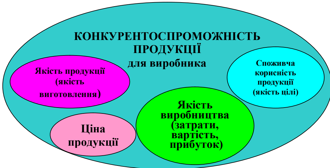
Рис.4. Фактори конкурентоспроможності продукції для виробника

Разом зі споживчою корисністю конкурентоспроможність продукції визначають - якість виготовлення, яка оцінює співвідношення E_B/C для споживача і ціна продукції, якість виробництва, яка оцінює затрати Z_{вр} , прибуток виробництва \Pi_p та питома собівартість продукції C_{бп} повинні бути присутніми при визначенні конкурентоспроможності продукції для її виробника (рис.4).