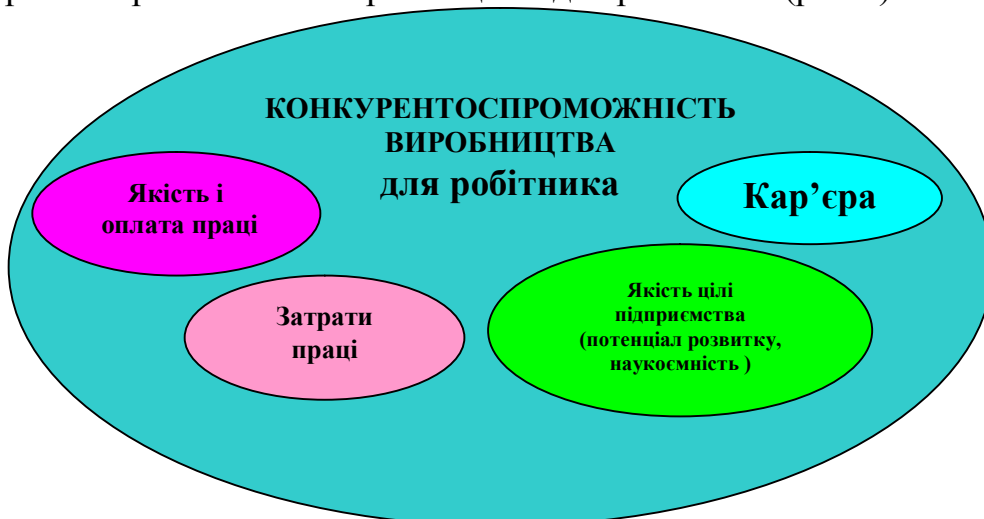
Рис.5. Фактори конкурентоспроможності виробництва для робітника

Всі ці чинники, разом з рівнем безпечності праці, є складовими конкурентоспроможності виробництва для робітника (рис 5).