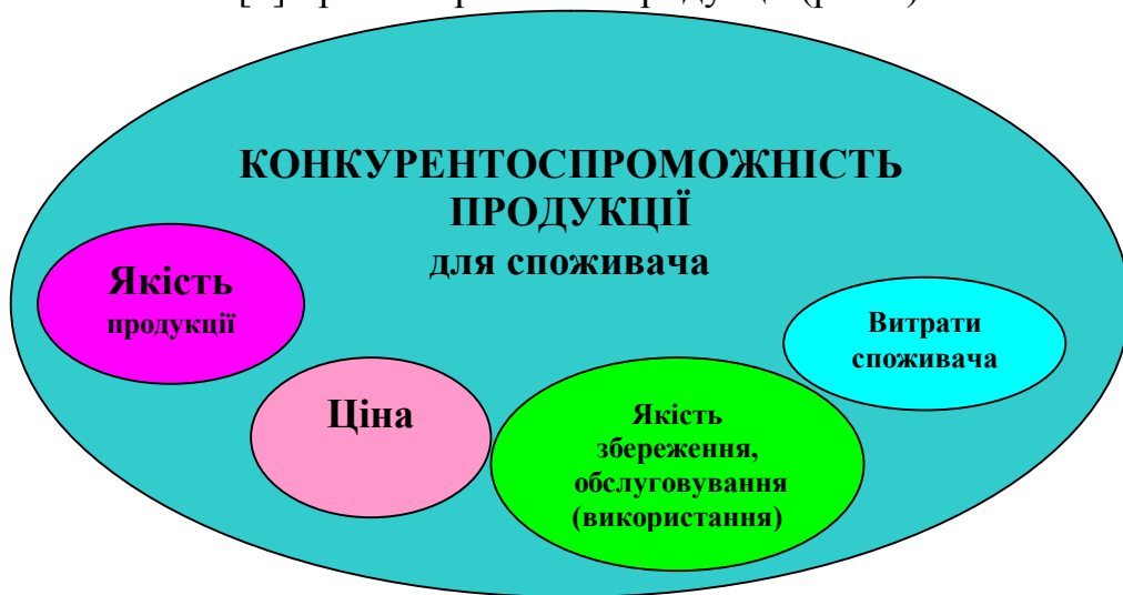
Рис.3 Фактори конкурентоспроможності продукції для споживача

В цій схемі конкурентоспроможність технічної продукції для споживача, яким є технологія виробництва тваринницької продукції, визначається її якістю і ціною, які є основними факторами досягнення конкурентоспроможності. Крім якості і ціни продукції конкуруючими факторами на ринку техніки стали якість збереження і технічного сервісу та витрати споживача[2] при використанні продукції (рис.3).