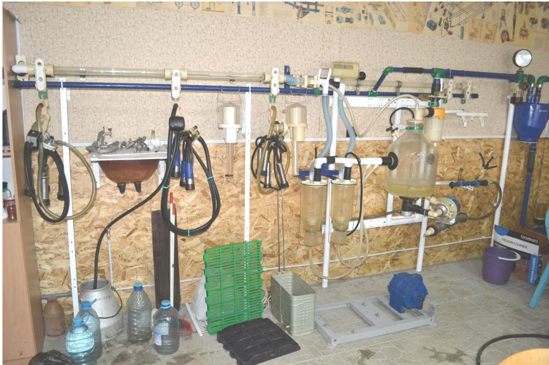
Рис. 1. Загальний вигляд експериментального стенду лінійної доїльної установки типу УДМ з верхнім молокопроводом

Основна частина. Для реалізації методики експериментальних дослідження процесу переміщення молокоповітряної суміші в доїльному апараті створено експериментальний стенд лінійної доїльної установки типу УДМ з верхнім молокопроводом (рис. 1), який відповідає вимогам ISO 5707 [1] і має точки для підключення реєструючої апаратури згідно з ISO 6690 [2] (рис. 2). Основними елементами які були задіяні під час досліджень були доїльний апарат (доїльні стакани, колектор, пульсатор молочний і вакуумний шланги), фотокамера, осцилограф до якого підключені датчики вакуумметричного тиску (рис. 3).