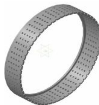
Рис.4. Рабочее кольцо.

При столкновении биомассы с отверстиями происходит измельчение за счет удара, а в зазоре между вращающимися навстречу друг другу колесами, происходит измельчение истиранием. Внешний вид колеса представлен на рис. 4.