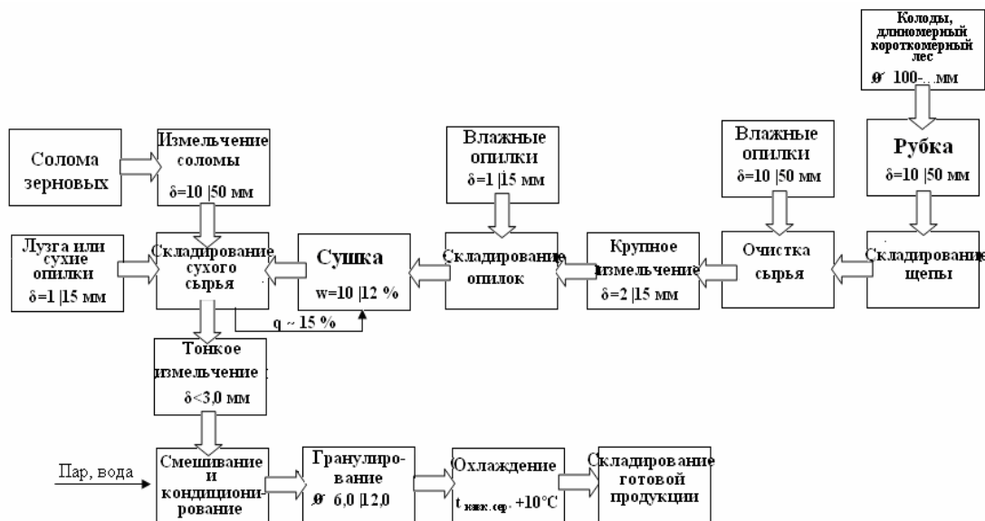
Рис. 1. Типовой технологический процесс получения твердого топлива.

Поэтому была разработана конструкция дезинтегратора, где используются два принципа измельчения: удар и истирание одновременно. В начале измельчения в большей степени используется удар, на конечной стадии измельчения – в большей степени используется истирание. Такая конструкция позволяет снизить энергозатраты на измельчение при одновременном повышении качества помола.