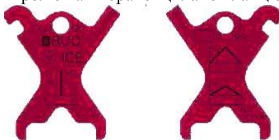
Рис. 2. Маркіровочна бирка.

В якості перевірного шаблону служить маркіровочна бирка для здійснення контролю та вибраковці ланок ланцюга (рис. 2).