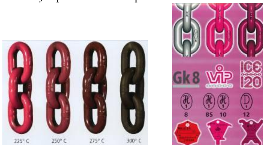
Рис. 3. Контроль якості ланцюгів.

Класи якості ланцюга: RUD в кольорі «ПІНК» клас якості 8, 10 (VIP) і (ICE). Високі міцнісні характеристики сталі, яка застосовується для ланцюгів, дозволяють знизити номінальний діаметр ланцюга без зміни вантажопідйомності стропів у порівнянні з нижчим класом якості. Зниження власної ваги стропів більш ніж на 30% забезпечує ергономічність в роботі.